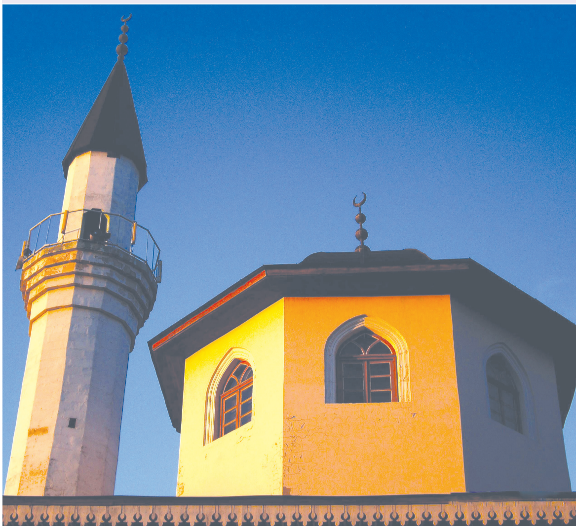
Фото недели: Мечеть Кебир-Джами. Симферополь.