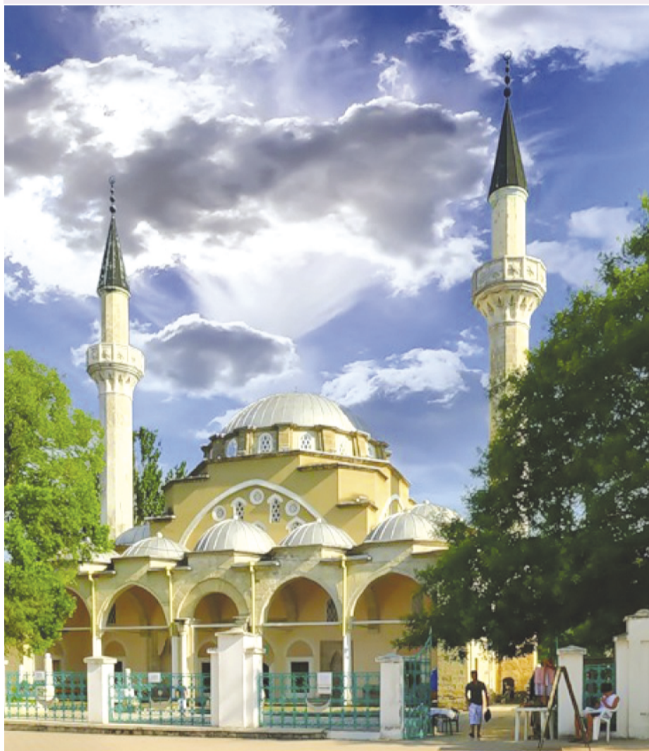
Фото недели: Мечеть Джума-Джами в Евпатории