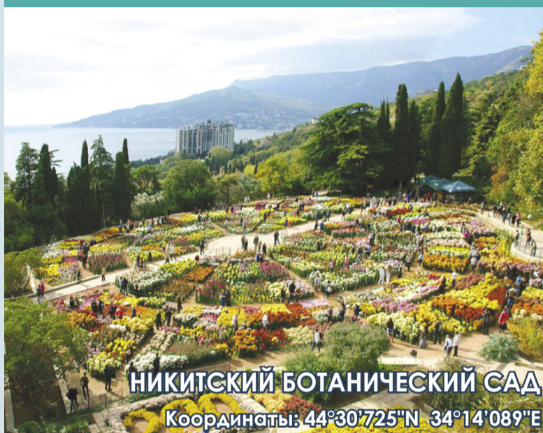
НИКИТСКИЙ БОТАНИЧЕСКИЙ САД Координаты: 44°30'725"N 34°14'089"E