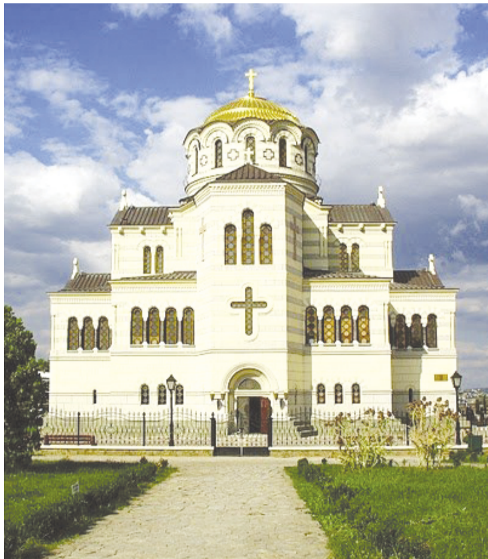
Фото недели: Свято-Владимирский кафедральный собор