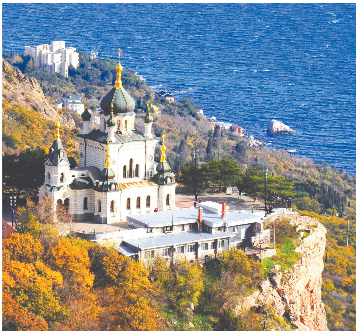
Фото недели: Форосская церковь