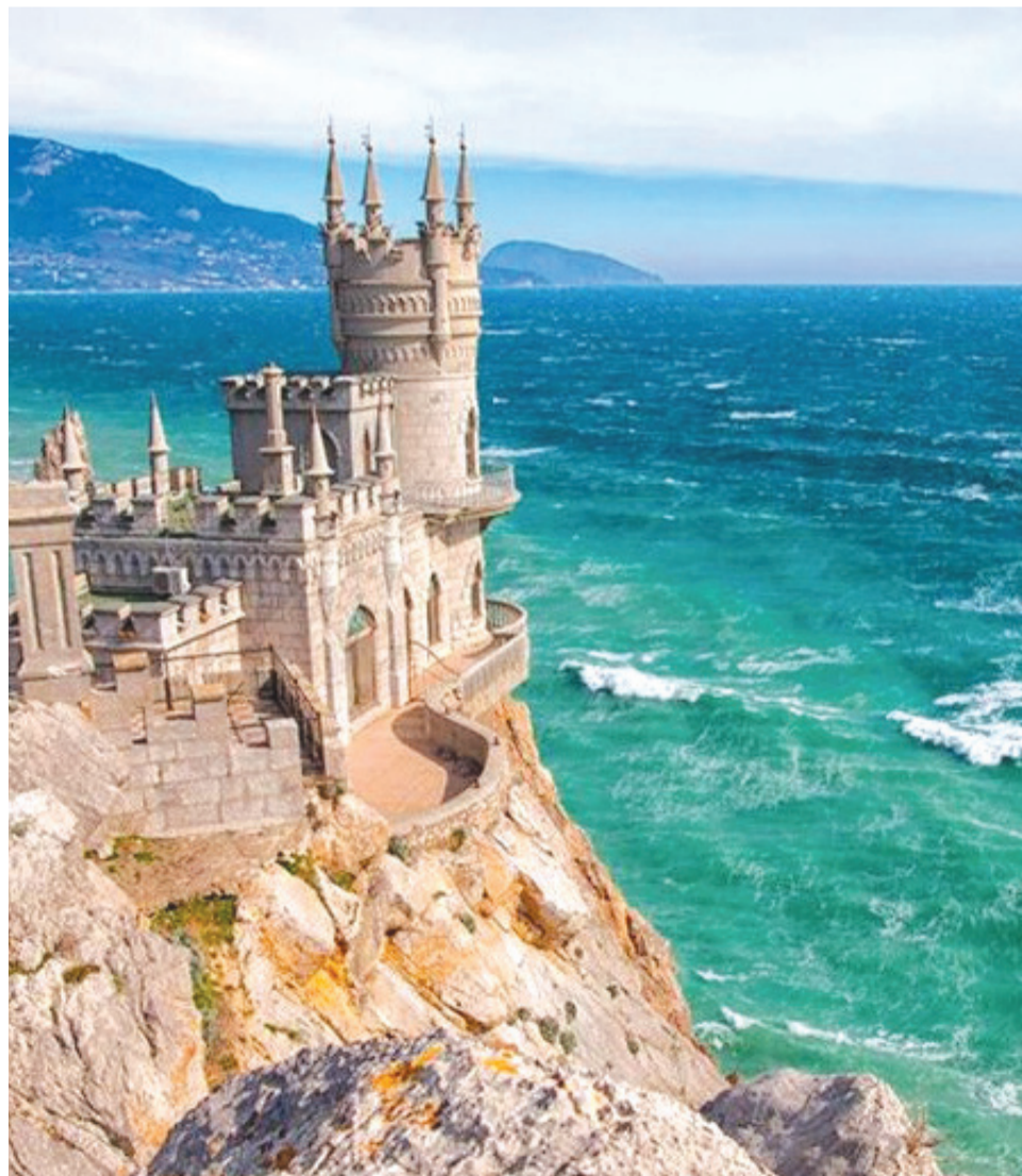
Фото недели: Ласточкино гнездо