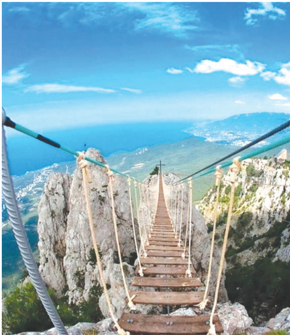
Фото недели: Гора Ай-Петри