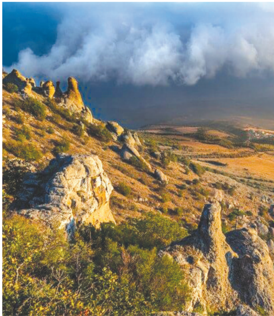
Фото недели: Долина привидений