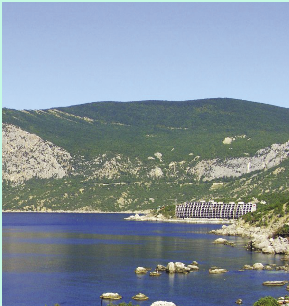
Автор Шейде Чалбаш