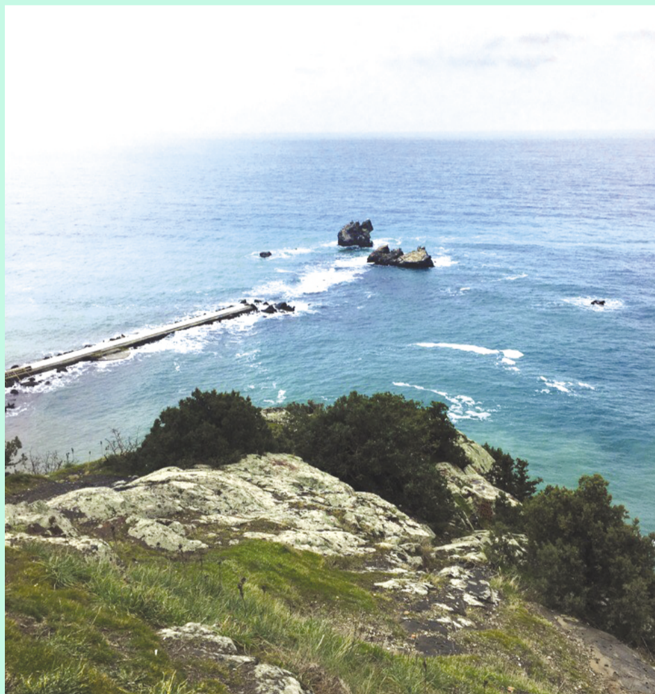
Автор Шейде Чалбаш