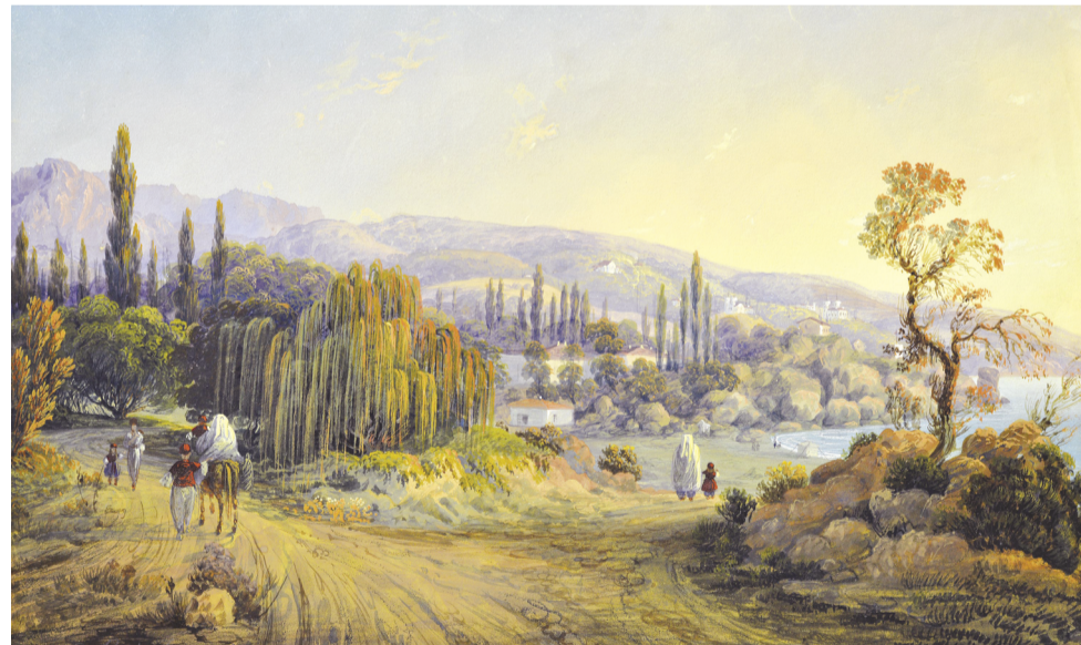
Ресим: Карло Боссоли. Къырым маназарасы ёлу иле, 1842 с.