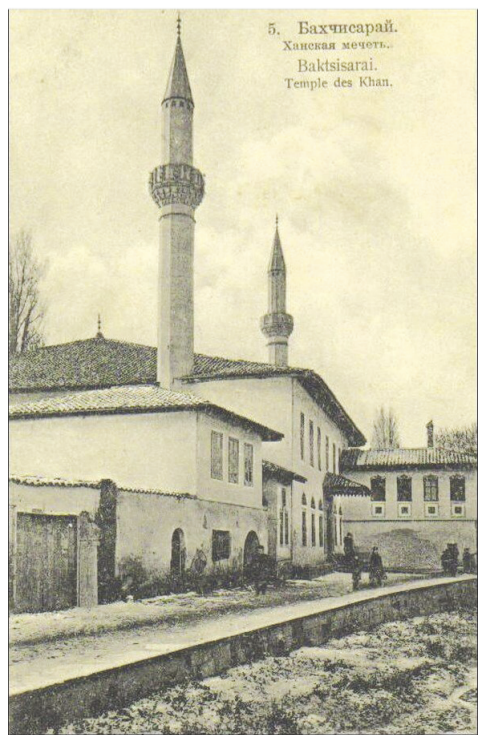
5. Бахчисарай. Ханская мечеть. Bakhtisarai. Temple des Khan.

Алтын сырмалы – вышитый золотом Басма – ситец Вадий – долина Дама оюны – шашки Дирек – столб Демирджихане – кузница Индемез – молчаливый Козетмек – наблюдать Кокюс кечирюв – вздох Къамчы – кнут Къозу терисинден – смушковый Къынтавлы – уютный Мал – товар Мейдан – площадь Мейхане – трактир Муляйим – милый Назар – взгляд Зияретчи – посетитель Окче – каблук Орюмчек ювасы – паутина Ортыю – покрывало Папуч – тапочки Пештахта – прилавок Сарыкъ – чалма Сундурма – навес Сый – угощение Татлы – милый, сладкий Уле – трубка (для курения) Хош – приятный Чаналатмакъ – тормозить Джийрен – рыжий Шартлатмакъ – цокать Шырын – милый Энъсе – затылок Эснев – зевота Ябанджы – посторонний