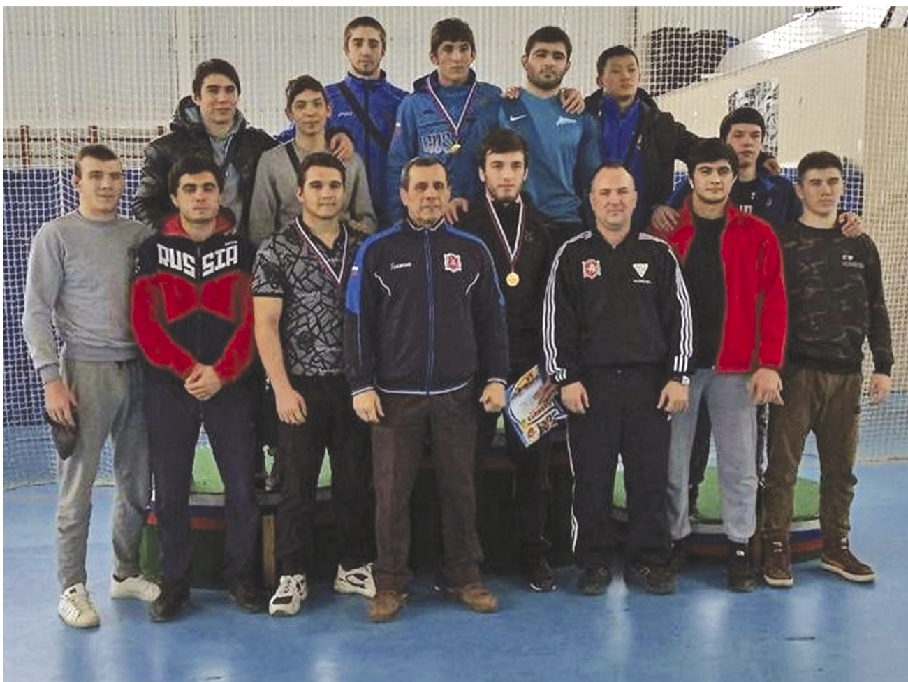
По материалам портала «Крымский спорт»

Соревнования были отборочными к первенству России среди юниоров, которое состоится 4-7 апреля во Владикавказе.