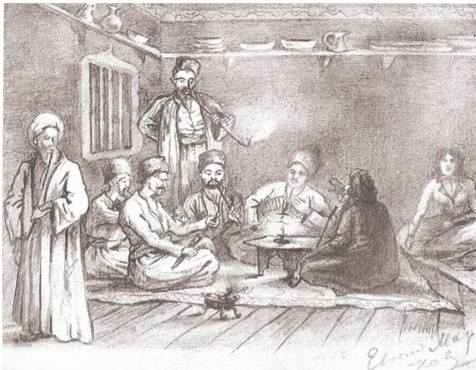
У татарина в Биюк-Узенбаше

Биз къаве ичмек ичюн кирген къавеханемиз къынтавлы эди. Темизлик севген яш къаведжи дама оюнойнагъан раатланджы зияретчилерге къавени ташый эди. Мени не ерден кельгенимни, Байдар вадийсинде берекет насыл олгъаныны, емиш-мейва фиятыны сорадылар ве бекленмеден: