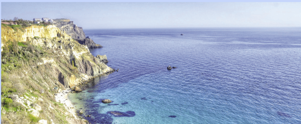
Фото недели: «мыс Фиолент»

С наилучшими пожеланиями от подруг Лили и Кати!