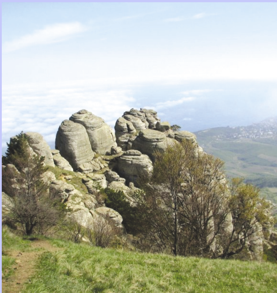
Автор Шейде Чалбаш