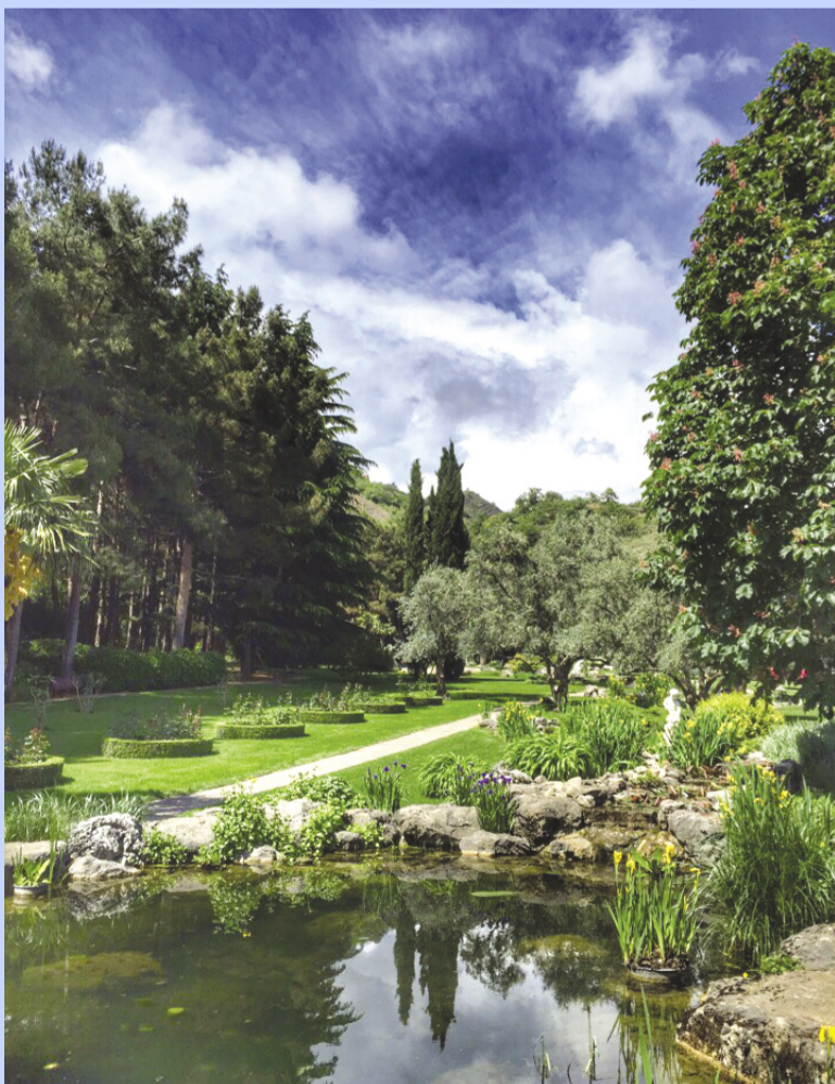
Фото недели: Партенит, парк им. И. Айвазовского