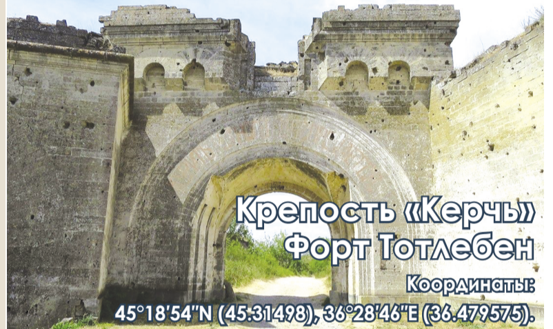
Крепость «Керчь» Форт Тотлебен