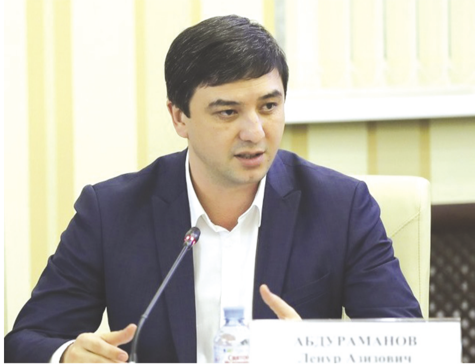
«Работа Госкомнаца направлена на сохранение и развитие исторически сложившегося межнационального и межконфессионального единства».

В период с декабря 2017 по декабрь 2018 года строительно-монтажные работы завершены по следующим объектам: строительство сетей канализации микрорайона Новониколаевка (Ак-Мечеть) г. Симферополь; строительство газопроводов низкого давления в п. Молодежное Симферопольского района; строительство сетей водоснабжения застройки с. Строгановка Симферопольского района; строительство сетей газоснабжения микрорайона Белое-4 г. Симферополь; строительство сетей газоснабжения в п. Айкаван Симферопольского района (1 очередь) и в мкр. Белое-6 (с. Ана-Юрт) Симферопольского района; строительство сетей электроснабжения микрорайона Белое-6 микрорайон 4 (с. Ана-Юрт) Симферопольского района, жилого массива улиц Ореховая и Гурзуфская, с. Н. Орешники Белогорского района; строительство наружных сетей электроснабжения жилой застройки микрорайона депортированных граждан по ул. Беспалова г. Симферополь. Кроме этого до 2022 года в рамках федеральной целевой программы в местах компактного проживания реабилитированных народов планируется ввести в эксплуатацию 7 детских садов на 1575 мест и 2 школы на 1080 мест, что позволит разрешить