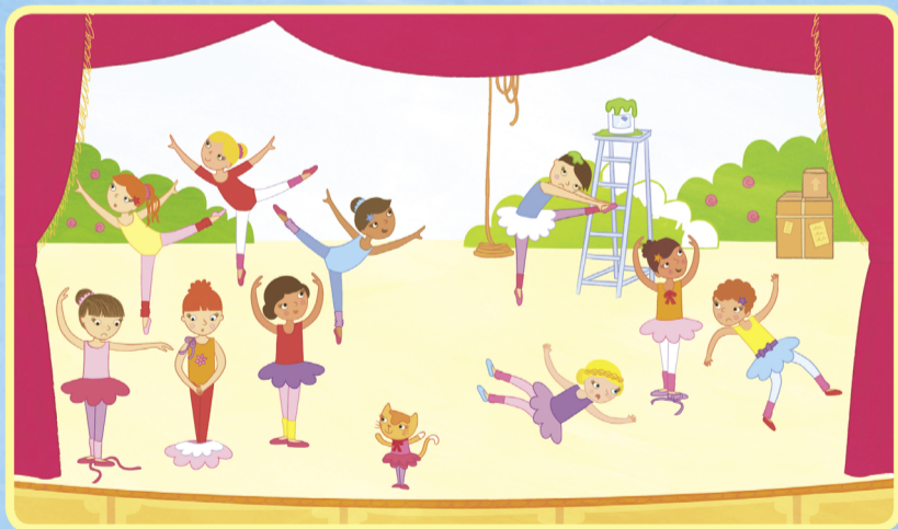
Оюнджылар чыкъышкъа азырланмакъталар. Ресимлернинъ арасында 10 фаркъ тапынъыз.