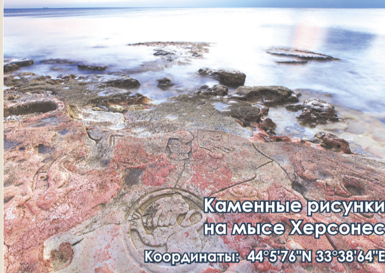
Каменные рисунки на мысе Херсонес