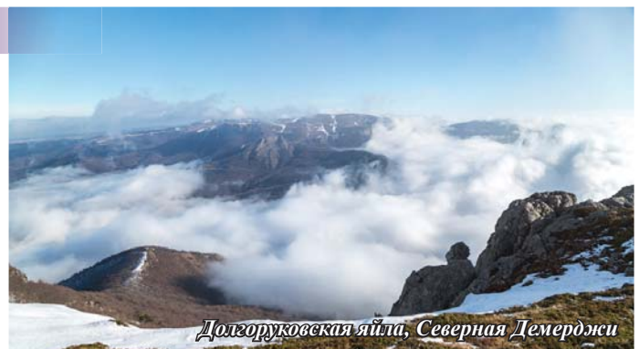
Долгоруковская яйла, Северная Демерджи