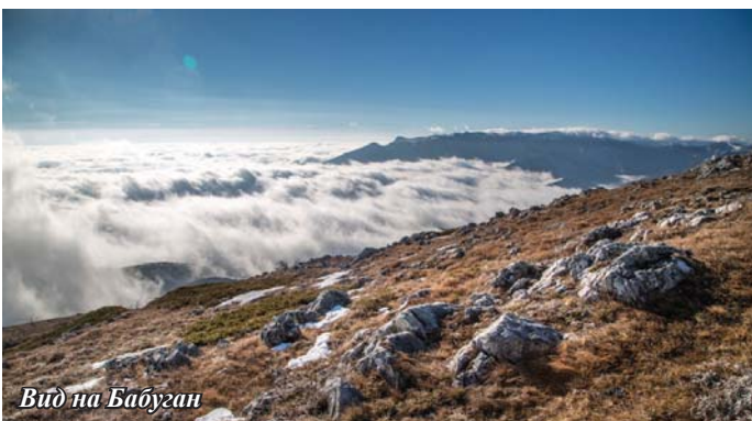
Вид на Бабуган