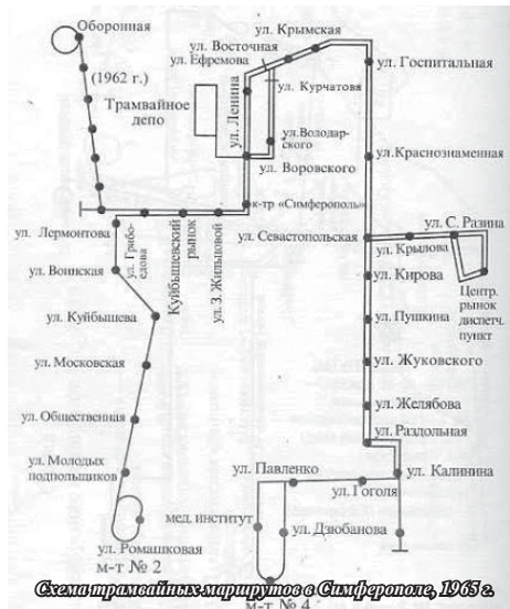
Схема трамвайных маршрутов в Симферополе, 1965 г. М-Т № 4

Несмотря на то, что решением облисполкома от 21 августа 1964 года намечалось в 1965–1966 г. построить новые трамвайные пути по улицам Калининна (1,2 км), Русской (4 км), Козлова и Красноармейской (5,3 км), Шмидта (1 км), власти начали планомерное наступление на позиции трамвая. Ни одна из планируемых трасс построена не была. Наоборот, в 1966 г. вместо продления, уничтожили уже имевшийся участок трам-