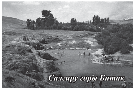
Салгиру горы Битак

Современный Салгир не отличается особым размахом, трудно представить в своём воображении пейзаж, восстановленный геологом Евгением Васильевой Львовской: - Салгир ещё шире раздвигает свои берега. На уровне нынешнего проспекта Кирова — до 700 метров от площади Советской до площади Куйбышева, - пишет геолог.