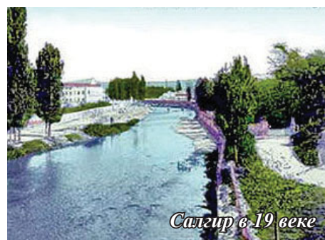
Салгир в 19 веке