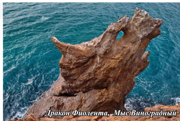
Дракон Фиолента, Мыс Виноградный