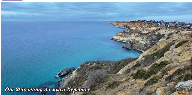
От Фиолента до мыса Херсонес