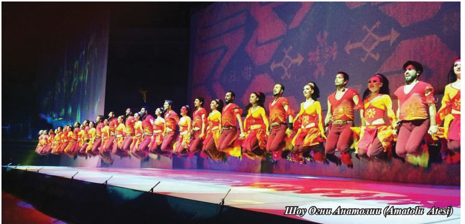
Шоу Огни Анатолии (Anadolu Atesi)

В настоящее время ансамбль представляет три шоу: шоу с одноименным названием «Огни Анатолии», представляющее собой дивертисмент танцев народов Турции, шоу «Троя», интерпретирующее языком танца бессмертную поэму Гомера, и шоу «Врата Востока» - выраженную в танце историю древнего города Эрзурума - ворот востока, центра