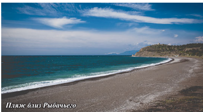
Пляж близ Рыбачьего