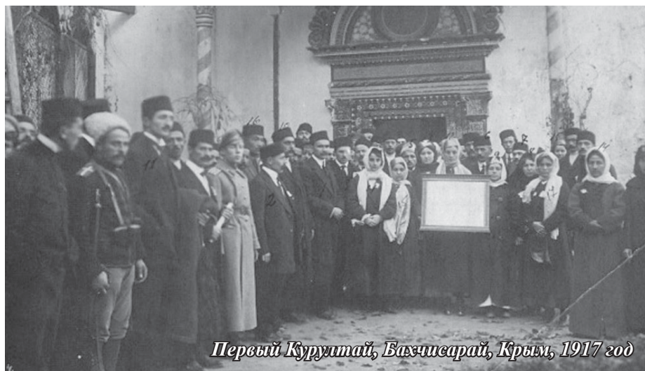
Первый Курултай, Бахчисарай, Крым, 1917 год