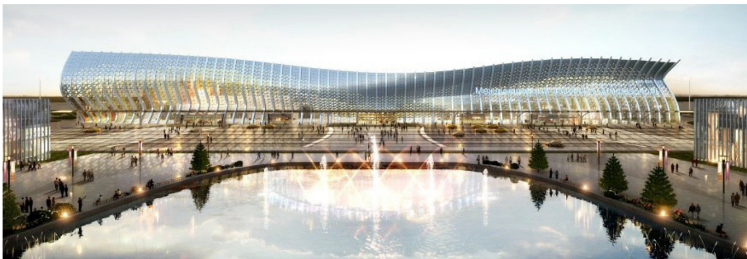
Международный аэропорт "Симферополь" – новый терминал

Реконструкции многих объектов, как и строительство новых, реализованы в рамках разработанной и утвержденной в 2016 году целевой программы «Воссоздание столичного облика и благоустройство города Симферополя». Подготовленная Департаментом архитектуры и строительства Республики Крым, программа легла в основу утвержденного 25 августа 2016 года Генерального плана Симферополя.