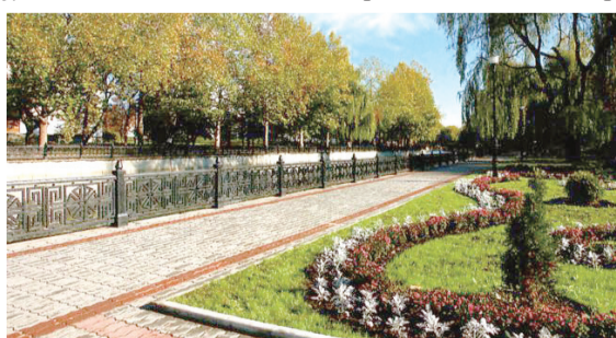
Макет реконструкции набережной Салгира

В рамках реконструкции стадиона «Локомотив», согласно Федеральной целевой