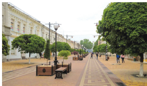
Новый облик улицы Пушкина

В рамках утвержденного генплана предусмотрен значительный объем работ – первые результаты горожане увидели на центральной улице им. Пушкина, где уже началась реконструкция. Обрушившиеся на Симферополь снегопады зимой 2016 года хоть и не смогли остановить проводимые работы, но привели к тому, что конечный результат вызвал возмущение не только у горожан, но и у властей города – плитка пошла волнами, стыки плиток не были отсыпаны песком, лив-