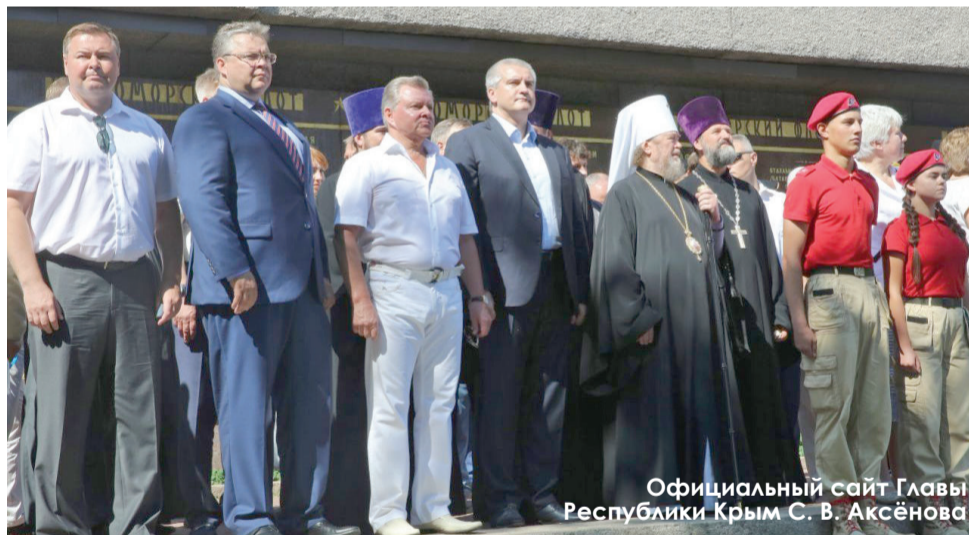
Официальный сайт Главы Республики Крым С. В. Аксёнова

– Президент Российской Федерации В. Путин